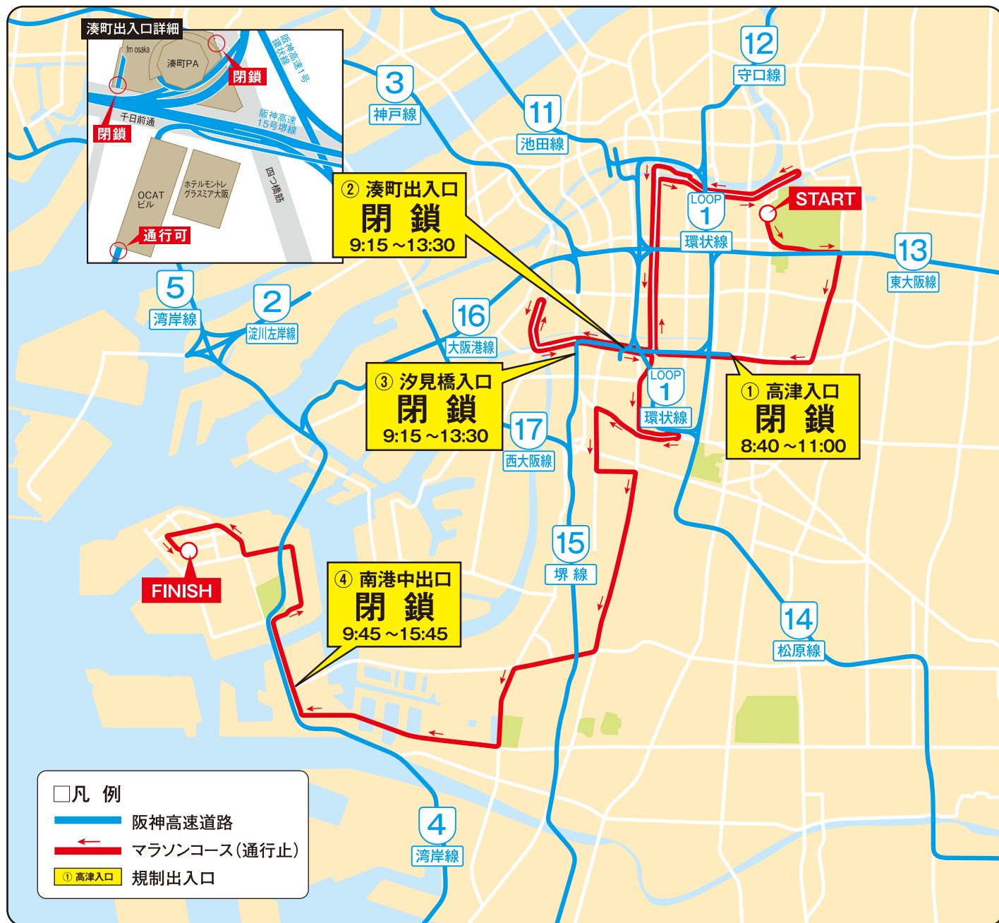
【阪神高速道路出入口規制一覧】