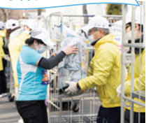
手荷物預かり・返却