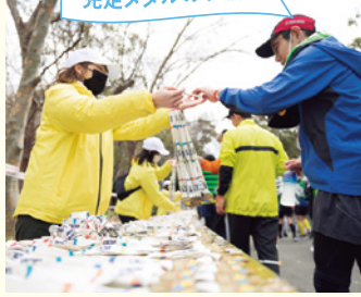
完走メダルのお渡し